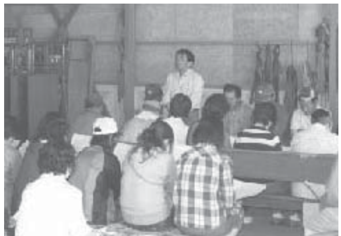
6月5日胡瓜出荷規格検討会