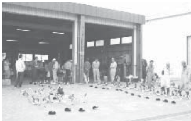
6月4日 本所農機センター前