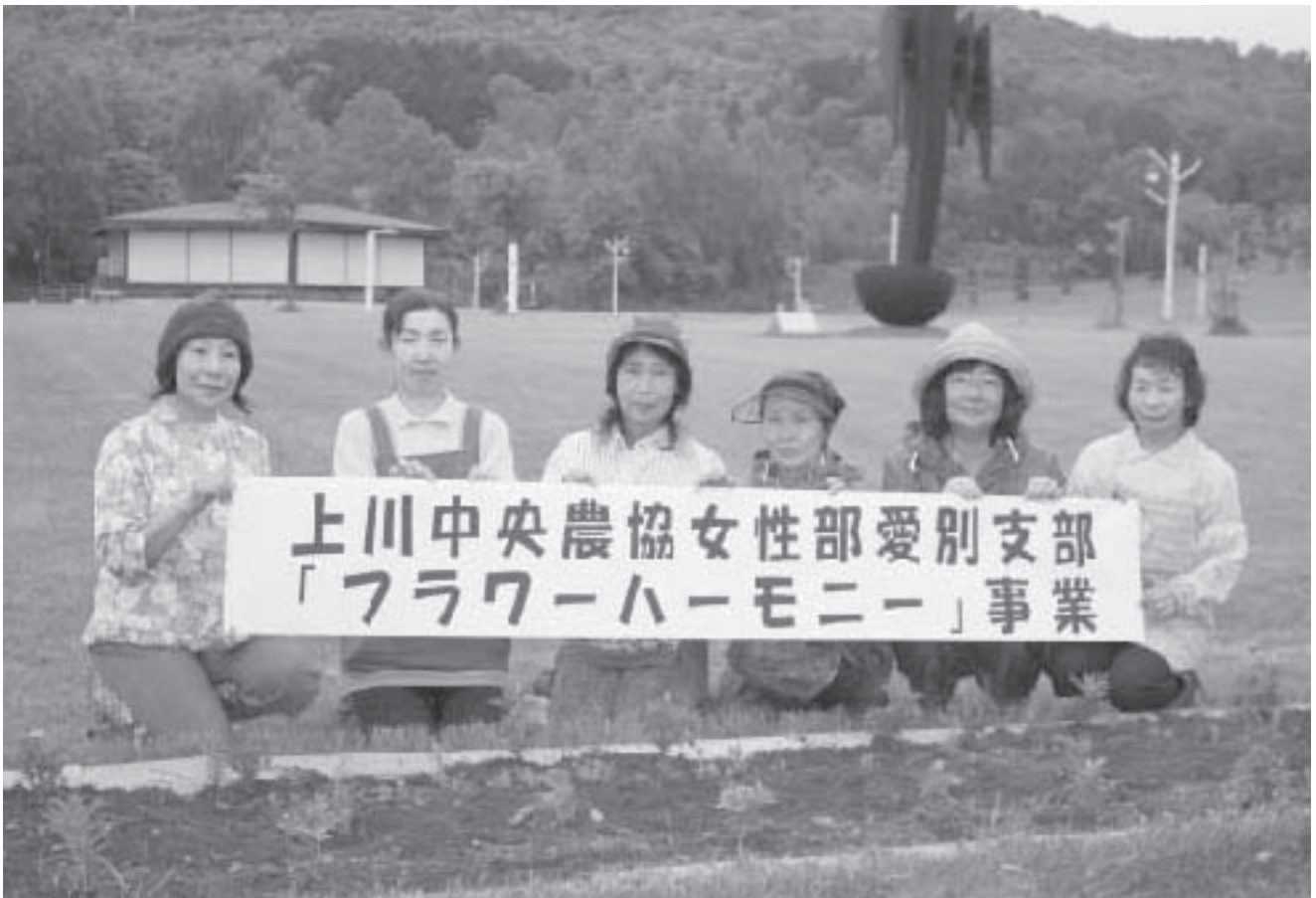
マリーゴールドの定植を終え記念撮影

豊かな自然に恵まれた北海道で、私たちは自然の大切さ、美しさ、素朴さを学ぶことができました。 今、潤いのある心豊かな生活を求める意識が高まり、自然景観や安らぎを求め農村を訪れる人が増加しています。 また、農村においても自然と調和した生活環境づくりが求められています。 そこで、JA上川地区女性協議会では、この雄大な自然と調和し、心豊かな農村生活環境づくりのため「花」をテーマに地域ごとに独創的な活動を展開しています。 農協女性部愛別支部では、6月8日部員が大事に育てたマリーゴールドの苗を愛別町北町の農村公園に定植しました。 苗はすくすくと成長しやがて綺麗な花を咲かせ、道行く人の目を楽しませてくれる事でしょう。