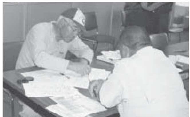
6月4日 米出荷契約受付