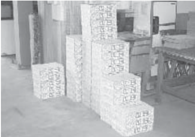
いちご出荷規格検討会当日に出荷されたいちご

各種現地研修会・出荷規格検討会が開催され、参加された生産者の皆さんは安心・安全で、より高品質な作物を消費者に提供するため、栽培管理等について活発な意見交換が行われました。