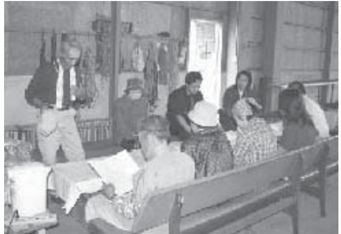
6月4日いちご出荷規格検討会