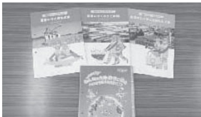
配布された教科書

教材を受け取った校長先生からは「有効に活用させていただきます」とお礼の言葉をいただきました。