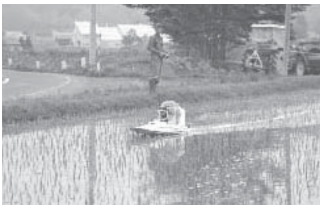
除草剤散布の様子