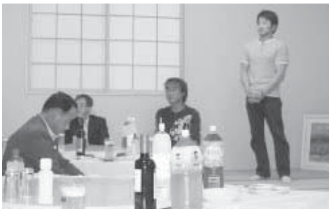
懇親会で挨拶する楠本部長