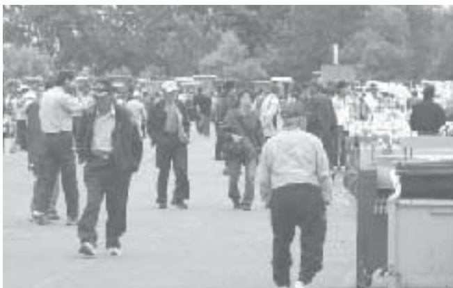
たくさんの方が訪れた会場