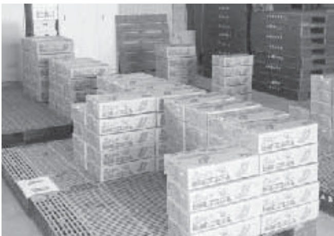
胡瓜出荷規格検討会当日出荷された胡瓜