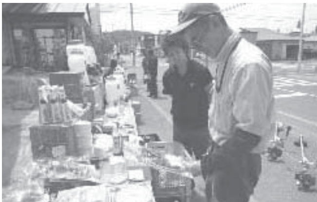
6月10日 上川支所資材店舗前

毎年恒例となりました農機具展示会が6月4日本所農機センター、6月10日上川支所資材店舗前で開催されました。展示会では、各メーカーの刈払機の展示の他に小農具の展示即売も行われ、たくさんの組合員の皆様にご来場いただき大盛況の内に展示会を終えました。来年も展示会を予定しておりますので、たくさんのご来場をお待ちしております。