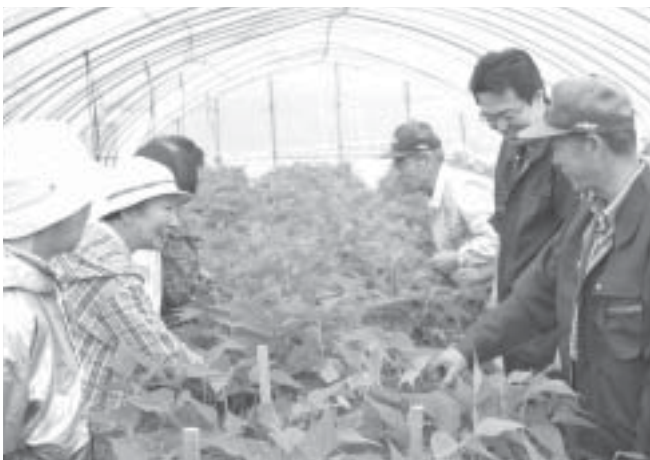
丸さやいんげん現地研修会