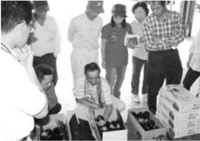
米なす出荷規格検討会

各種現地研修会・出荷規格検討会が開催され、参加された生産者の皆さんは安心・安全で、より高品質な作物を消費者に提供するため、栽培管理等について活発な意見交換が行われました。