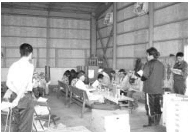
ミニトマト出荷規格検討会