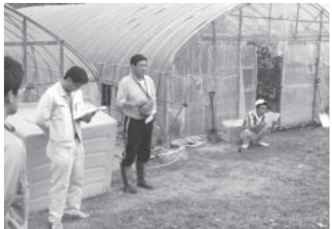
ミニトマト現地研修会