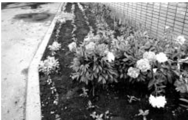
綺麗に定植された花

苗はすくすくと成長し、やがて綺麗な花を咲かせ、道行く人の目を楽しませてくれる事でしょう。