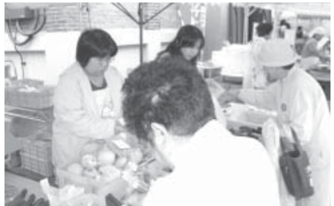
朝もぎ母さんの会による野菜の販売