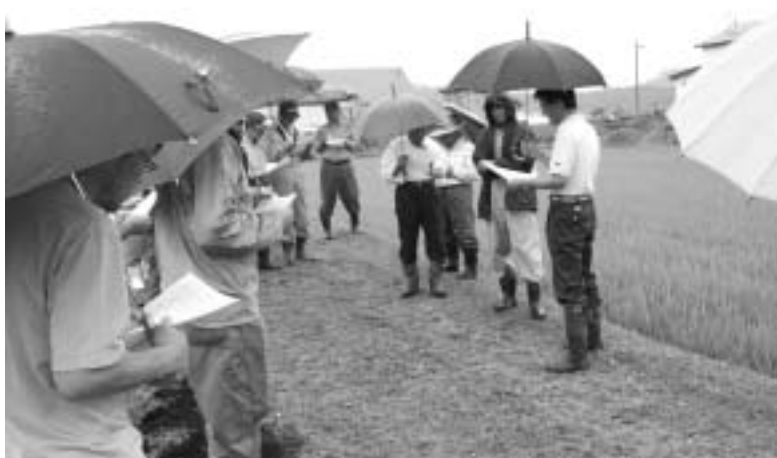
雨天の中開催された講習会