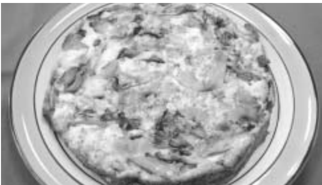
舞茸とハムのクラフティー