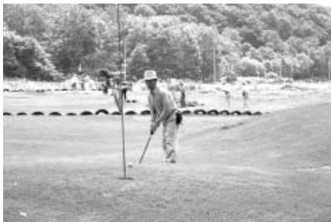
パークゴルフの様様