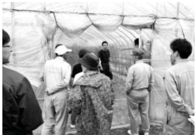
アスパラ現地研修会