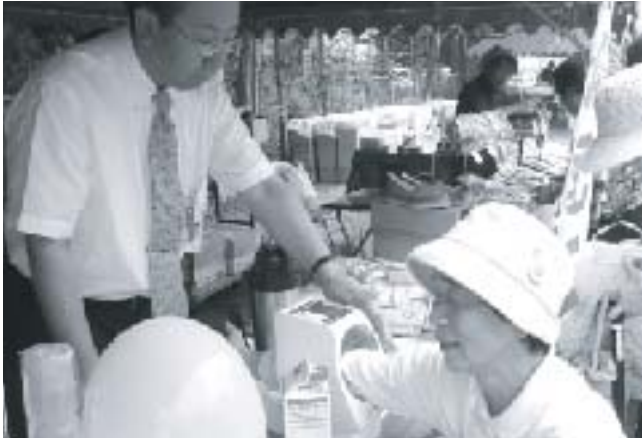
健康相談コーナー