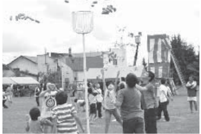
こども玉入れ大会