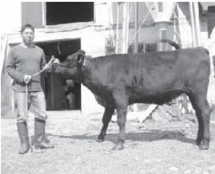
全道共進会入賞に向け牛の手入れをしています