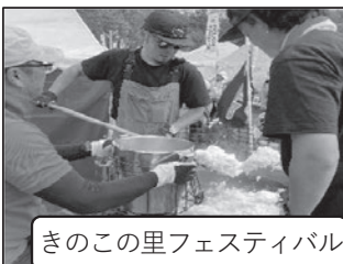
きのこの里フェスティバル