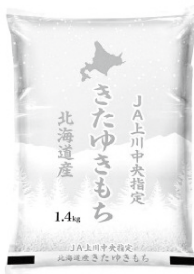
野上米穀 JA上川中央指定 北海道産きたゆきもち 1.4kg

この度、埼玉県を中心に関東圏内で展開している(株)ベルク様(スーパーマーケット)において、2月からJA上川中央産を謳った、きたゆきもちの店頭販売が始まりました。 『JA上川中央産』の商品名としての販売に取り組んでいた中で、(株)ベルク様に結び付いたものです。 (株)ベルク様からは、JA上川中央産のもち米は品質が良いと高評価を得ており、引き続き信頼を得られるよう良品質なもち米生産に取り組み販売拡大を図って参りたいと考えております。